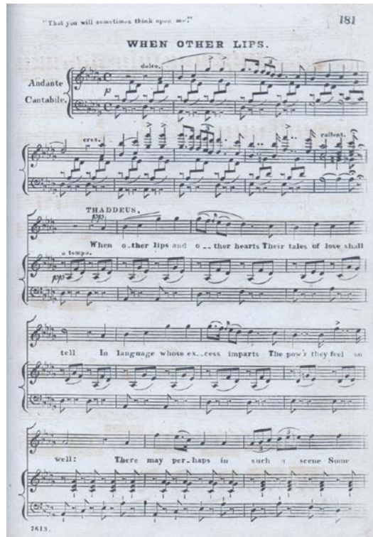
FIGURA 6: Primera página del aria "When other lips", p. 181

induce a uno de los suyos a disparar contra Thaddeus cuando él y Arline se abrazan. Un movimiento de Devilshoof desvía el tiro, que se dirige hacia la propia Reina; ella muere en el acto. La ópera termina con gran alegría por la unión de la pareja. El aria final de Arline “ Oh, what full delight ”, en Do Mayor, pone punto final a esta ópera y se escucha a lo lejos una última vez el leit motiv, el tema del coro de gitanos: “ In the gipsy’s life you read ”.