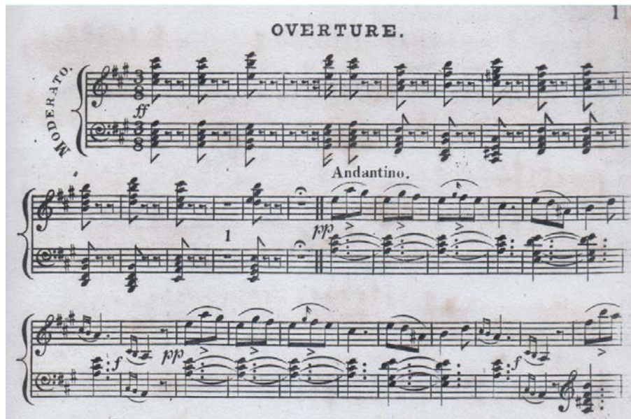
FIGURA 1: Introducción y tema del sueño, p. 1