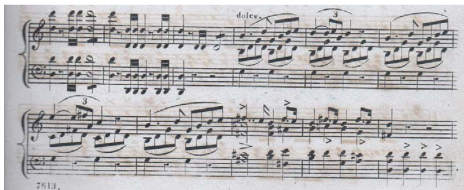
FIGURA 2: Tema de los gitanos, p. 3

Después de esta larga página orquestal 5 da comienzo la acción. Estamos ante el castillo del conde Arnheim, gobernador de Pressburg y sus dominios. Algunos criados del conde izan la bandera austríaca; todos excepto él se preparan para una cacería. El conde, leal al imperio austríaco, ensalza la vida del soldado en la cavatina “ A soldier’s life ”, a la que le sigue, después de un coro de cazadores, una breve cabaletta. Su hija Arline, de seis años, va con ellos y con Buda, su niñera.